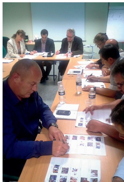
Journée de sensibilisation à Moisy : sont présents les équipes de la région, du montage, du CTR et d'Eneria.